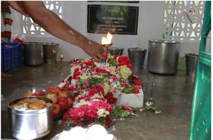
முருகனார் ஆராதனை - ஸ்ரீரமணாச்சரமம்