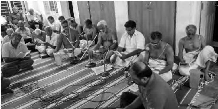
'ரமண சந்நிதிமுறை' கூட்டுப் பாராயணம்