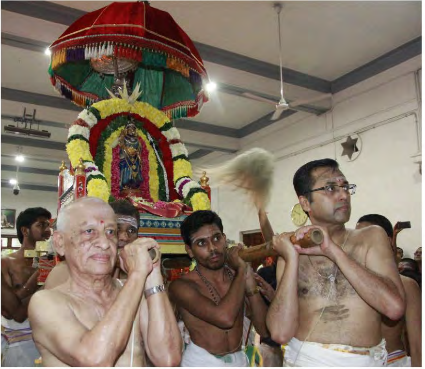
ஸ்ரீ ரமணாச்சரமம் நவராத்திரி விழாக் காட்சிகள்