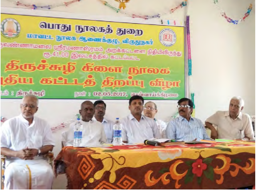
திருச்சுழி புதிய நூலகக் கட்டிடம் திறப்பு விழா (2-5-2017)