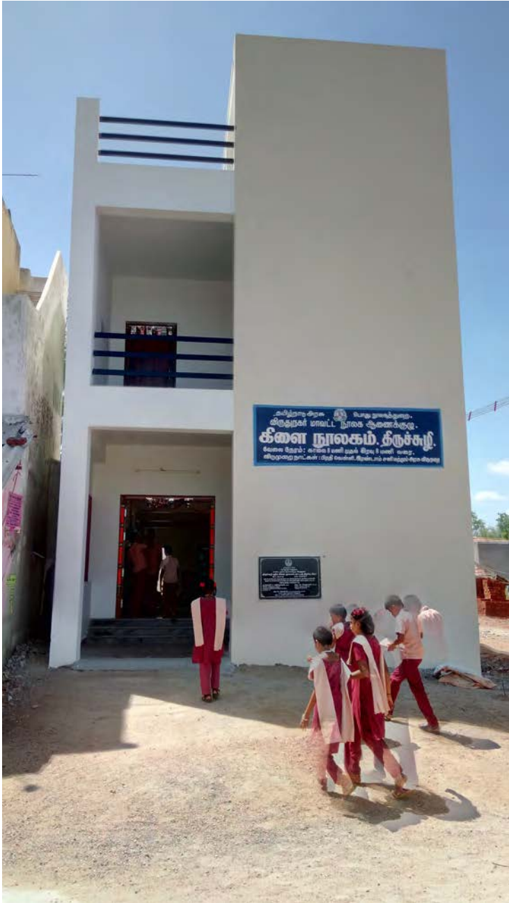
திருச்சுழி புதிய நூலகம்