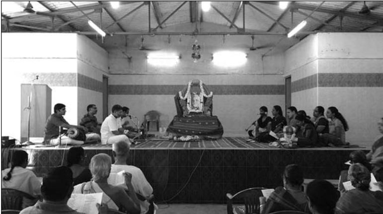
ஸ்ரீரமண சத்சங்கம், நங்கைநல்லூர், சென்னை

டிசம்பர் 27 ஞாயிறன்று காலை 5.30 மணி முதல் மஹன்யாஸம், ஏகாதச ருத்ர ஜபம், அபிஷேகம், ரமண சஹஸ்ரநாம அர்ச்சனை, அக்ஷரமணமாலை பாராயணம், அன்னதானத்துடன் சிறப்பாக நடைபெற்றது.