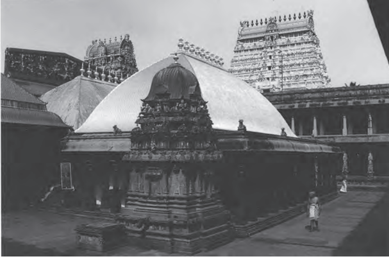
நடராஜர் ஆலயம், சிதம்பரம்

அண்டத்தில் உள்ளது, பிண்டத்திலும் உண்டு. பிண்டமும் பிரம்மாண்டமும் சமம். மனித உடலில் நடு ஸ்தலமான இதயத்தில் உள்ள சைதன்யமாகிய சிவம் ஆகாசம். சாந்தோக்கிய, கைவல்ய உபநிடதங்களில் கூறப்பட்டதே தகரவித்தை. வேதங்கள், மற்றும் சாத்திர சமயநூல்களைப் பயிலுவதின் நோக்கன் என்னவெனில்: