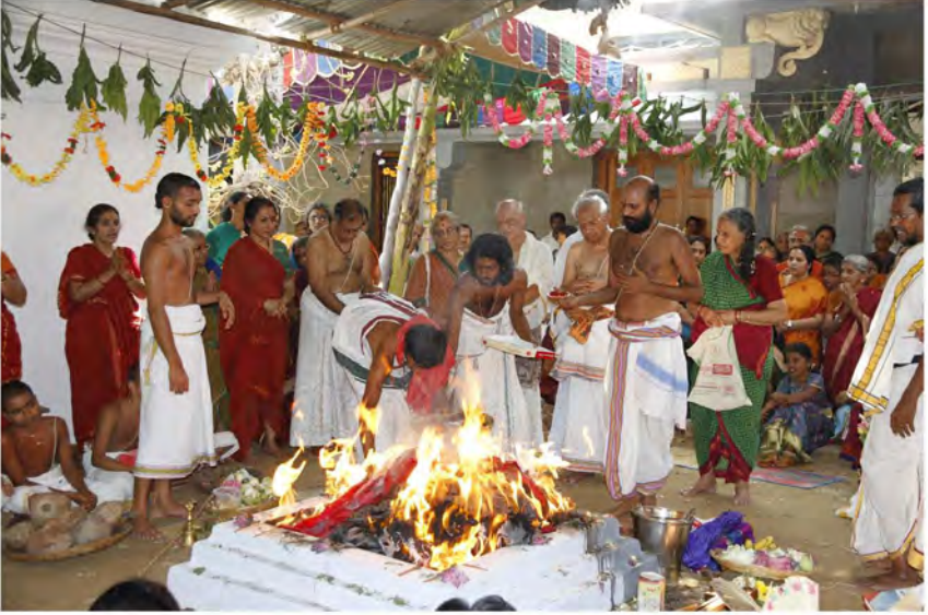
ஸ்ரீ ரமணாச்சரமம், திருவண்ணாமலையில் 15-3-2013 அன்று நடைபெற்ற ஸ்ரீவித்யா ஹோம நிகழ்வுகள்